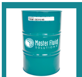
Tambo de 54 galones (204 l) SKU: OE315NS-54G UPC-12: 641238076667