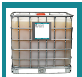
Contenedor tipo bolsa de 270 galones (1022 l) SKU: OE315NS-270G UPC-12: 641238077565