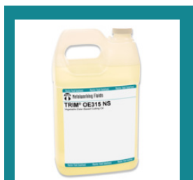
Cubeta de 1 galones (3.7 l) SKU: OE315NS-1G UPC-12: 641238077541