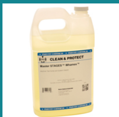
Cubeta de 1 galones (3.7 l) SKU: WHAMEX-1G UPC-12: 641238027294