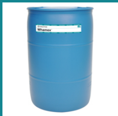
Tambo de 54 galones (204 l) SKU: WHAMEX-54G UPC-12: 641238027324