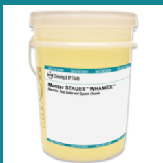
Cubeta de 5 galones (19 l) SKU: WHAMEX-5G UPC-12: 641238027317