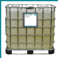
Contenedor tipo bolsa de 270 galones (1022 l) SKU: WHAMEX-270G UPC-12: 641238033165