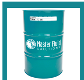
Tambo de 54 galones (204 l) SKU: TC257-54G UPC-12: 641238083122