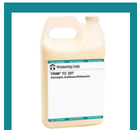
Cubeta de 1 galones (3.7 l) SKU: TC257-1G UPC-12: 641238083078