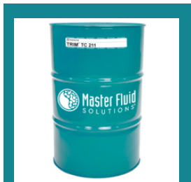
Tambo de 54 galones (204 l) SKU: TC211-54G UPC-12: 641238010944