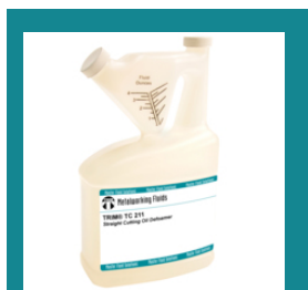
Punta de 2 cuartos de medida "N" ® SKU: TC211-2Q UPC-12: 641238074144