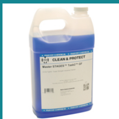
Cubeta de 1 galones (3.7 l) SKU: TASK2GF-1G UPC-12: 641238031321