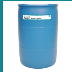
Tambo de 54 galones (204 l) SKU: TASK2GF-54G UPC-12: 641238031352

Es posible que se haya utilizado DeepL para traducir parte de esta hoja de datos. Si observa algún error, por favor, háganoslo saber: webmaster4mfs@gmail.com