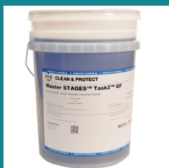
Cubeta de 5 galones (19 l) SKU: TASK2GF-5G UPC-12: 641238031345