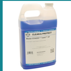
Cubeta de 1 galones (3.7 l) SKU: TASK2GF-1G UPC-12: 641238031321