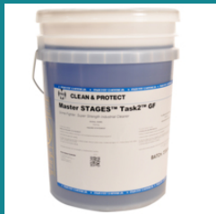
Cubeta de 5 galones (19 l) SKU: TASK2GF-5G UPC-12: 641238031345