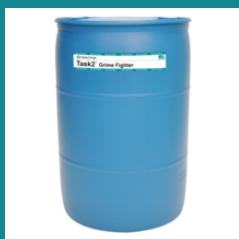
Tambo de 54 galones (204 l) SKU: TASK2GF-54G UPC-12: 641238031352

Es posible que se haya utilizado DeepL para traducir parte de esta hoja de datos. Si observa algún error, por favor, háganoslo saber: webmaster4mfs@gmail.com