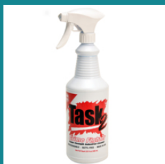
Frasco de 1 cuarto SKU: TASK2GF-QT UPC-12: 641238030195