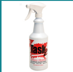
Frasco de 1 cuarto SKU: TASK2GF-QT UPC-12: 641238030195