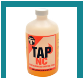
Frasco de 1 pinta SKU: TAPNC-1P UPC-12: 641238009429