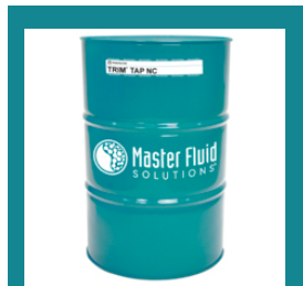
Tambo de 54 galones (204 l) SKU: TAPNC-54G UPC-12: 641238009399