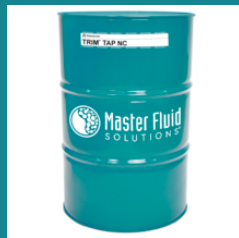
Tambo de 54 galones (204 l) SKU: TAPNC-54G UPC-12: 641238009399