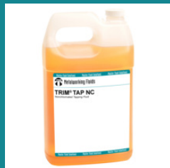
Cubeta de 1 galones (3.7 l) SKU: TAPNC-1G UPC-12: 641238009337