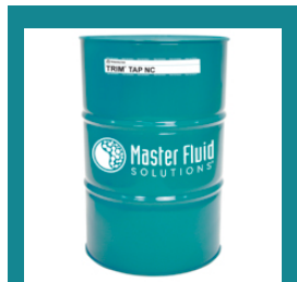
Tambo de 54 galones (204 l) SKU: TAPNC-54G UPC-12: 641238009399

Es posible que se haya utilizado DeepL para traducir parte de esta hoja de datos. Si observa algún error, por favor, háganoslo saber: webmaster4mfs@gmail.com