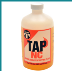
Frasco de 1 pinta SKU: TAPNC-1P UPC-12: 641238009429