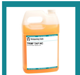
Cubeta de 1 galones (3.7 l) SKU: TAPNC-1G UPC-12: 641238009337