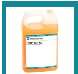
Cubeta de 1 galones (3.7 l) SKU: TAPNC-1G UPC-12: 641238009337