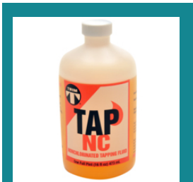
Frasco de 1 pinta SKU: TAPNC-1P UPC-12: 641238009429