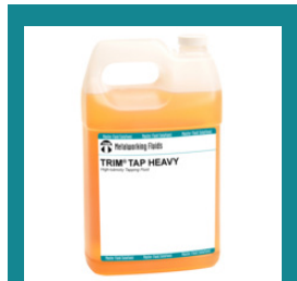
Cubeta de 1 galones (3.7 l) SKU: TAPHVY-1G UPC-12: 641238008989