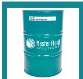
Tambo de 54 galones (204 l) SKU: TAPHVY-54G UPC-12: 641238009047