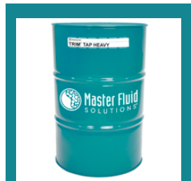
Tambo de 54 galones (204 l) SKU: TAPHVY-54G UPC-12: 641238009047