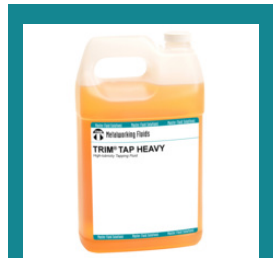
Cubeta de 1 galones (3.7 l) SKU: TAPHVY-1G UPC-12: 641238008989