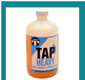
Frasco de 1 pinta SKU: TAPHVY-1P UPC-12: 641238009078