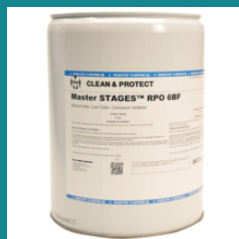
Cubeta de 5 galones (19 l) SKU: RPO6BF-5G UPC-12: 641238003311