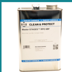
Cubeta de 1 galones (3.7 l) SKU: RPO6BF-1G UPC-12: 641238003298