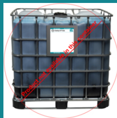
Contenedor tipo bolsa de 270 galones (1022 l) SKU: RPO6BF-270G UPC-12: