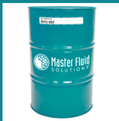
Tambo de 54 galones (204 l) SKU: RPO6BF-54G UPC-12: 641238003274