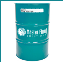
Tambo de 54 galones (204 l) SKU: OV2200-54G UPC-12: 641238070559