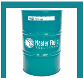
Tambo de 54 galones (204 l) SKU: OV2200-54G UPC-12: 641238070559