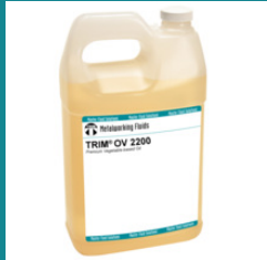
Cubeta de 1 galones (3.7 l) SKU: OV2200-1G UPC-12: 641238070528