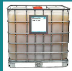
Contenedor tipo bolsa de 270 galones (1022 l) SKU: OV2200-270G UPC-12: 641238070566