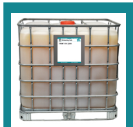
Contenedor tipo bolsa de 270 galones (1022 l) SKU: OV2200-270G UPC-12: 641238070566