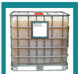
Contenedor tipo bolsa de 270 galones (1022 l) SKU: OE322NS-270G UPC-12: 641238077619