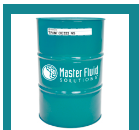
Tambo de 54 galones (204 l) SKU: OE322NS-54G UPC-12: 641238076643