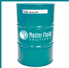
Tambo de 54 galones (204 l) SKU: OE322NS-54G UPC-12: 641238076643