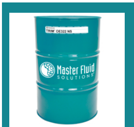
Tambo de 54 galones (204 l) SKU: OE322NS-54G UPC-12: 641238076643