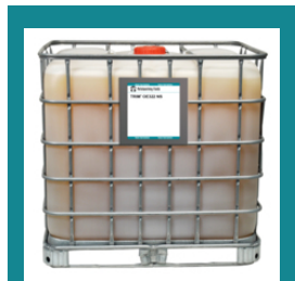
Contenedor tipo bolsa de 270 galones (1022 l) SKU: OE322NS-270G UPC-12: 641238077619