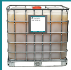
Contenedor tipo bolsa de 270 galones (1022 l) SKU: OE322NS-270G UPC-12: 641238077619