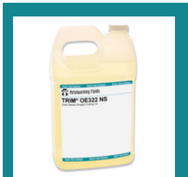
Cubeta de 1 galones (3.7 l) SKU: OE322NS-1G UPC-12: 641238077596