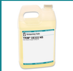
Cubeta de 1 galones (3.7 l) SKU: OE322NS-1G UPC-12: 641238077596