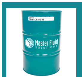
Tambo de 54 galones (204 l) SKU: OE310NS-54G UPC-12: 641238076728