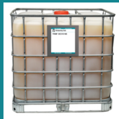
Contenedor tipo bolsa de 270 galones (1022 l) SKU: OE310NS-270G UPC-12: 641238077510