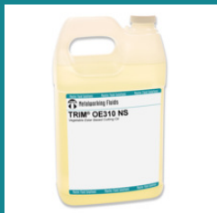
Cubeta de 1 galones (3.7 l) SKU: OE310NS-1G UPC-12: 641238077497