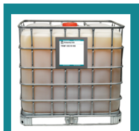
Contenedor tipo bolsa de 270 galones (1022 l) SKU: OE310NS-270G UPC-12: 641238077510