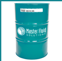
Tambo de 54 galones (204 l) SKU: OE310NS-54G UPC-12: 641238076728