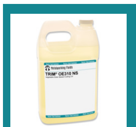
Cubeta de 1 galones (3.7 l) SKU: OE310NS-1G UPC-12: 641238077497