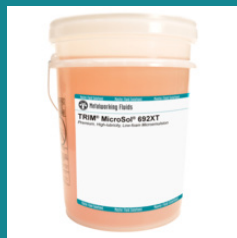
Cubeta de 5 galones (19 l) SKU: MS692XT-5G UPC-12: 641238080121