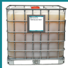
Contenedor tipo bolsa de 270 galones (1022 l) SKU: MS692XT-270G UPC-12: 641238080145