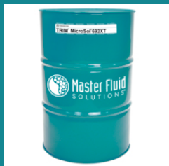
Tambo de 54 galones (204 l) SKU: MS692XT-54G UPC-12: 641238080114