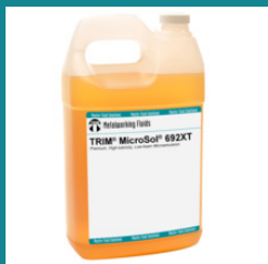
Cubeta de 1 galones (3.7 l) SKU: MS692XT-1G UPC-12: 641238080138