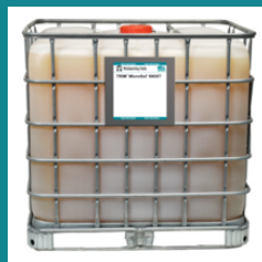
Contenedor tipo bolsa de 270 galones (1022 l) SKU: MS690XT-270G UPC-12: 641238073017

Es posible que se haya utilizado DeepL para traducir parte de esta hoja de datos. Si observa algún error, por favor, háganoslo saber: webmaster4mfs@gmail.com