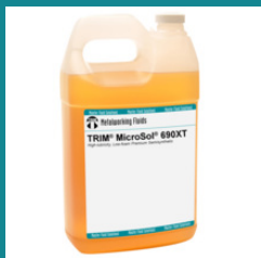
Cubeta de 1 galones (3.7 l) SKU: MS690XT-1G UPC-12: 641238072973