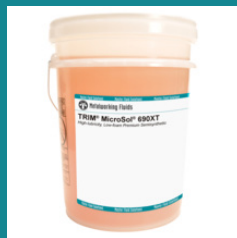
Cubeta de 5 galones (19 l) SKU: MS690XT-5G UPC-12: 641238072997