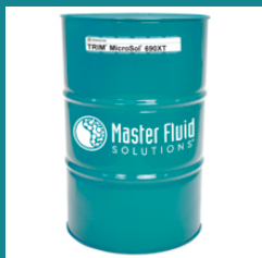
Tambo de 54 galones (204 l) SKU: MS690XT-54G UPC-12: 641238073000