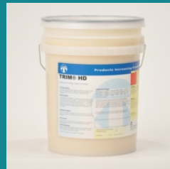
Cubeta de 5 galones (19 l) SKU: HD-5G UPC-12: 641238003670