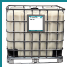
Contenedor tipo bolsa de 270 galones (1022 l) SKU: HD-270G UPC-12: 641238046875

Es posible que se haya utilizado DeepL para traducir parte de esta hoja de datos. Si observa algún error, por favor, háganoslo saber: webmaster4mfs@gmail.com