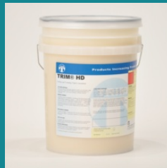
Cubeta de 5 galones (19 l) SKU: HD-5G UPC-12: 641238003670