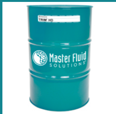
Tambo de 54 galones (204 l) SKU: HD-54G UPC-12: 641238003687