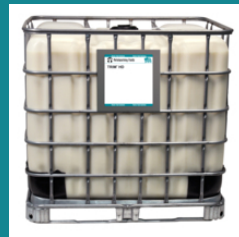
Contenedor tipo bolsa de 270 galones (1022 l) SKU: HD-270G UPC-12: 641238046875

Es posible que se haya utilizado DeepL para traducir parte de esta hoja de datos. Si observa algún error, por favor, háganoslo saber: webmaster4mfs@gmail.com