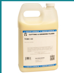
Cubeta de 1 galones (3.7 l) SKU: HD-1G UPC-12: 641238003656