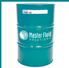
Tambo de 54 galones (204 l) SKU: HD-54G UPC-12: 641238003687