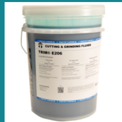
Cubeta de 5 galones (19 l) SKU: E206-5G UPC-12: 641238003083