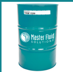
Tambo de 54 galones (204 l) SKU: E206-54G UPC-12: 641238003090