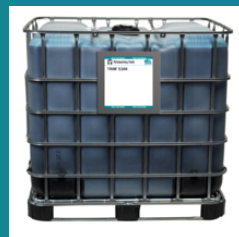
Contenedor tipo bolsa de 270 galones (1022 l) SKU: E206-270G UPC-12: 641238033882

Es posible que se haya utilizado DeepL para traducir parte de esta hoja de datos. Si observa algún error, por favor, háganoslo saber: webmaster4mfs@gmail.com