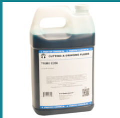
Cubeta de 1 galones (3.7 l) SKU: E206-1G UPC-12: 641238003052