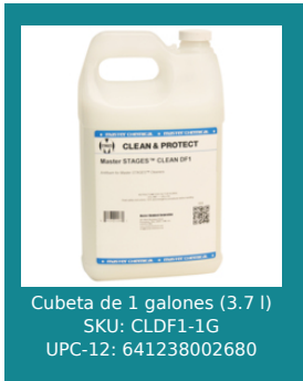
Cubeta de 1 galones (3.7 l) SKU: CLDF1-1G UPC-12: 641238002680