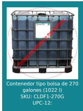
Contenedor tipo bolsa de 270 galones (1022 l) SKU: CLDF1-270G UPC-12: