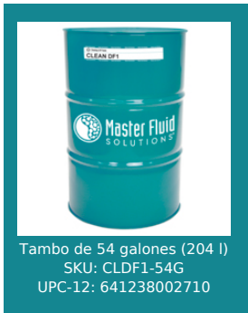
Tambo de 54 galones (204 l) SKU: CLDF1-54G UPC-12: 641238002710