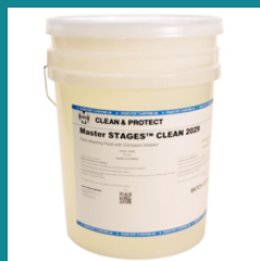
Cubeta de 5 galones (19 l) SKU: CL2029-5G UPC-12: 641238002109