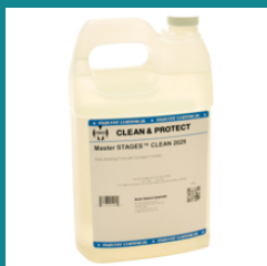
Cubeta de 1 galones (3.7 l) SKU: CL2029-1G UPC-12: 641238019909