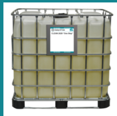
Contenedor tipo bolsa de 270 galones (1022 l) SKU: CL2029-270G UPC-12: 641238033837

Es posible que se haya utilizado DeepL para traducir parte de esta hoja de datos. Si observa algún error, por favor, háganoslo saber: webmaster4mfs@gmail.com