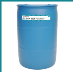
Tambo de 54 galones (204 l) SKU: CL2029-54G UPC-12: 641238002116