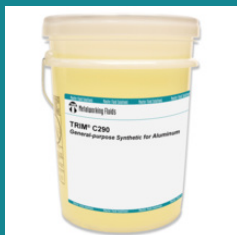
Cubeta de 5 galones (19 l) SKU: C290-5G UPC-12: 641238082378