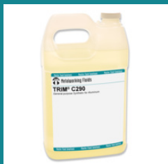
Cubeta de 1 galones (3.7 l) SKU: C290-1G UPC-12: 641238082354