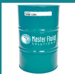
Tambo de 54 galones (204 l) SKU: C290-54G UPC-12: 641238082385