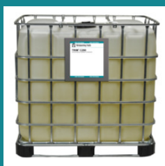
Contenedor tipo bolsa de 270 galones (1022 l) SKU: C290-270G UPC-12: 641238082392