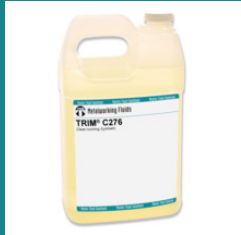
Cubeta de 1 galones (3.7 l) SKU: C276-1G UPC-12: 641238043171