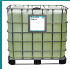
Contenedor tipo bolsa de 270 galones (1022 l) SKU: C276-270G UPC-12: 641238043232