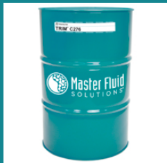
Tambo de 54 galones (204 l) SKU: C276-54G UPC-12: 641238043218