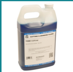
Cubeta de 1 galones (3.7 l) SKU: C270BD-1G UPC-12: 641238066743