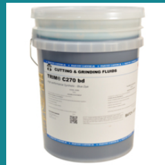
Cubeta de 5 galones (19 l) SKU: C270BD-5G UPC-12: 641238001300