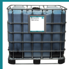
Contenedor tipo bolsa de 270 galones (1022 l) SKU: C270BD-270G UPC-12: 641238034018

Es posible que se haya utilizado DeepL para traducir parte de esta hoja de datos. Si observa algún error, por favor, háganoslo saber: webmaster4mfs@gmail.com