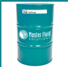
Tambo de 54 galones (204 l) SKU: C270BD-54G UPC-12: 641238001317