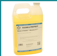
Bidon de 1 gallon (3,8 l) SKU: WHMXXT-1G UPC-12: 641238069416