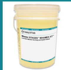
Seau de 5 gallons (19 l) SKU: WHMXXT-5G UPC-12: 641238069409