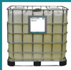
Cuve de 270 gallons (1022 l) SKU: WHAMEX-270G UPC-12: 641238033165

DeepL a peut-être été utilisé pour traduire certaines parties de cette fiche technique. N'hésitez pas à nous signaler toute erreur à corriger : webmaster4mfs@gmail.com