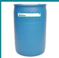
Fût de 54 gallons (204 l) SKU: WHAMEX-54G UPC-12: 641238027324