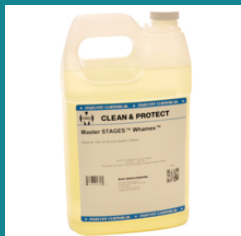
Bidon de 1 gallon (3,8 l) SKU: WHAMEX-1G UPC-12: 641238027294