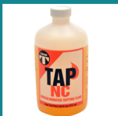
Flacon de 1 chopine (473 ml) SKU: TAPNC-1P UPC-12: 641238009429