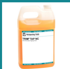
Bidon de 1 gallon (3,8 l) SKU: TAPNC-1G UPC-12: 641238009337