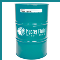
Fût de 54 gallons (204 l) SKU: TAPNC-54G UPC-12: 641238009399