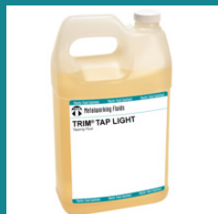
Bidon de 1 gallon (3,8 l) SKU: TAPLT-1G UPC-12: 641238009139