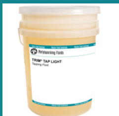
Seau de 5 gallons (19 l) SKU: TAPLT-5G UPC-12: 641238009184