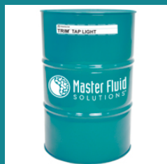
Fût de 54 gallons (204 l) SKU: TAPLT-54G UPC-12: 641238009191

DeepL a peut-être été utilisé pour traduire certaines parties de cette fiche technique. N'hésitez pas à nous signaler toute erreur à corriger : webmaster4mfs@gmail.com