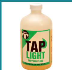
Flacon de 1 chopine (473 ml) SKU: TAPLT-1P UPC-12: 641238009221