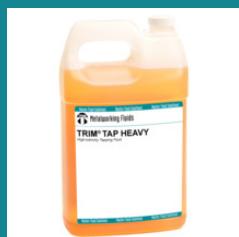
Bidon de 1 gallon (3,8 l) SKU: TAPHVY-1G UPC-12: 641238008989