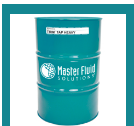
Fût de 54 gallons (204 l) SKU: TAPHVY-54G UPC-12: 641238009047