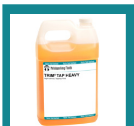
Bidon de 1 gallon (3,8 l) SKU: TAPHVY-1G UPC-12: 641238008989