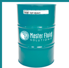
Fût de 54 gallons (204 l) SKU: TAPHVY-54G UPC-12: 641238009047