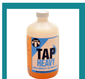
Flacon de 1 chopine (473 ml) SKU: TAPHVY-1P UPC-12: 641238009078