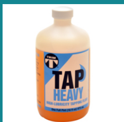
Flacon de 1 chopine (473 ml) SKU: TAPHVY-1P UPC-12: 641238009078