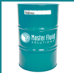
Fût de 54 gallons (204 l) SKU: SOL-54G UPC-12: 641238008408