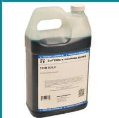
Bidon de 1 gallon (3,8 l) SKU: SOL-1G UPC-12: 641238008361