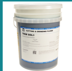
Seau de 5 gallons (19 l) SKU: SOL-5G UPC-12: 641238008392