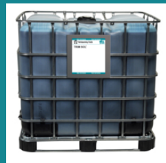
Cuve de 270 gallons (1022 l) SKU: SOL-270G UPC-12: 641238034216

DeepL a peut-être été utilisé pour traduire certaines parties de cette fiche technique. N'hésitez pas à nous signaler toute erreur à corriger : webmaster4mfs@gmail.com