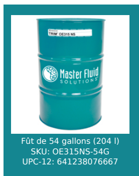
Fût de 54 gallons (204 l) SKU: OE315NS-54G UPC-12: 641238076667