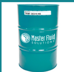
Fût de 54 gallons (204 l) SKU: OE315NS-54G UPC-12: 641238076667