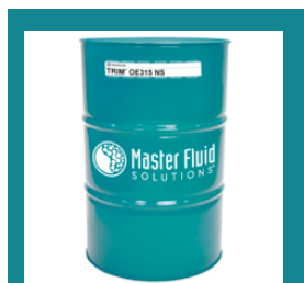
Fût de 54 gallons (204 l) SKU: OE315NS-54G UPC-12: 641238076667