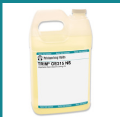
Bidon de 1 gallon (3,8 l) SKU: OE315NS-1G UPC-12: 641238077541