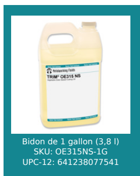
Bidon de 1 gallon (3,8 l) SKU: OE315NS-1G UPC-12: 641238077541