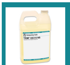
Bidon de 1 gallon (3,8 l) SKU: OE315NS-1G UPC-12: 641238077541