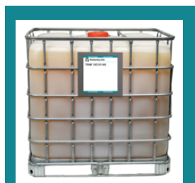
Cuve de 270 gallons (1022 l) SKU: OE315NS-270G UPC-12: 641238077565

DeepL a peut-être été utilisé pour traduire certaines parties de cette fiche technique. N'hésitez pas à nous signaler toute erreur à corriger : webmaster4mfs@gmail.com