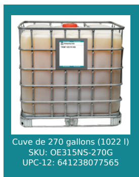
Cuve de 270 gallons (1022 l) SKU: OE315NS-270G UPC-12: 641238077565

DeepL a peut-être été utilisé pour traduire certaines parties de cette fiche technique. N'hésitez pas à nous signaler toute erreur à corriger : webmaster4mfs@gmail.com