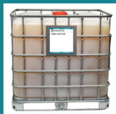
Cuve de 270 gallons (1022 l) SKU: OE315NS-270G UPC-12: 641238077565