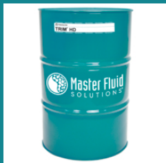
Fût de 54 gallons (204 l) SKU: HD-54G UPC-12: 641238003687