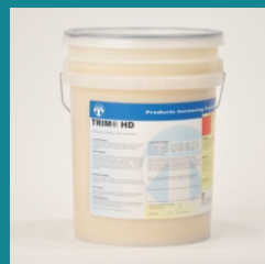
Seau de 5 gallons (19 l) SKU: HD-5G UPC-12: 641238003670