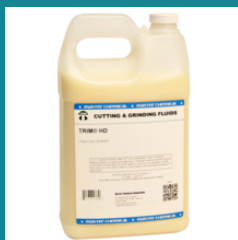
Bidon de 1 gallon (3,8 l) SKU: HD-1G UPC-12: 641238003656