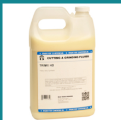
Bidon de 1 gallon (3,8 l) SKU: HD-1G UPC-12: 641238003656