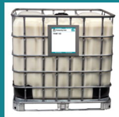
Cuve de 270 gallons (1022 l) SKU: HD-270G UPC-12: 641238046875

DeepL a peut-être été utilisé pour traduire certaines parties de cette fiche technique. N'hésitez pas à nous signaler toute erreur à corriger : webmaster4mfs@gmail.com