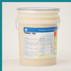
Seau de 5 gallons (19 l) SKU: HD-5G UPC-12: 641238003670