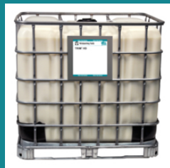
Cuve de 270 gallons (1022 l) SKU: HD-270G UPC-12: 641238046875

DeepL a peut-être été utilisé pour traduire certaines parties de cette fiche technique. N'hésitez pas à nous signaler toute erreur à corriger : webmaster4mfs@gmail.com