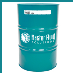
Fût de 54 gallons (204 l) SKU: HD-54G UPC-12: 641238003687