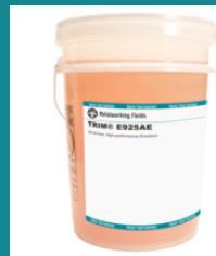
Seau de 5 gallons (19 l) SKU: E925AE-5G UPC-12: 641238077114