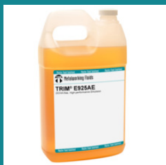
Bidon de 1 gallon (3,8 l) SKU: E925AE-1G UPC-12: 641238077121