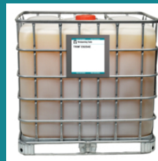
Cuve de 270 gallons (1022 l) SKU: E925AE-270G UPC-12: 641238077145

DeepL a peut-être été utilisé pour traduire certaines parties de cette fiche technique. N'hésitez pas à nous signaler toute erreur à corriger : webmaster4mfs@gmail.com