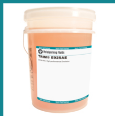
Seau de 5 gallons (19 l) SKU: E925AE-5G UPC-12: 641238077114