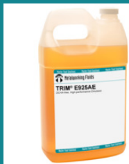
Bidon de 1 gallon (3,8 l) SKU: E925AE-1G UPC-12: 641238077121