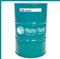
Fût de 54 gallons (204 l) SKU: E925AE-54G UPC-12: 641238077107