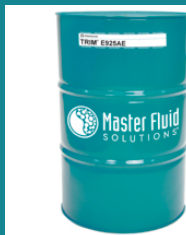
Fût de 54 gallons (204 l) SKU: E925AE-54G UPC-12: 641238077107