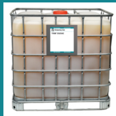
Cuve de 270 gallons (1022 l) SKU: E925AE-270G UPC-12: 641238077145