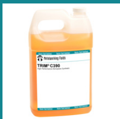
Bidon de 1 gallon (3,8 l) SKU: C390-1G UPC-12: 641238075783