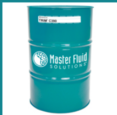
Fût de 54 gallons (204 l) SKU: C390-54G UPC-12: 641238075738