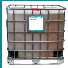
Cuve de 270 gallons (1022 l) SKU: C390-270G UPC-12: 641238075752

DeepL a peut-être été utilisé pour traduire certaines parties de cette fiche technique. N'hésitez pas à nous signaler toute erreur à corriger : webmaster4mfs@gmail.com