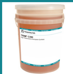
Seau de 5 gallons (19 l) SKU: C390-5G UPC-12: 641238075745