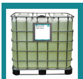
Cuve de 270 gallons (1022 l) SKU: C270CG-270G UPC-12: 641238042723

DeepL a peut-être été utilisé pour traduire certaines parties de cette fiche technique. N'hésitez pas à nous signaler toute erreur à corriger : webmaster4mfs@gmail.com