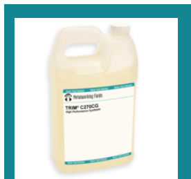
Bidon de 1 gallon (3,8 l) SKU: C270CG-1G UPC-12: 641238042686