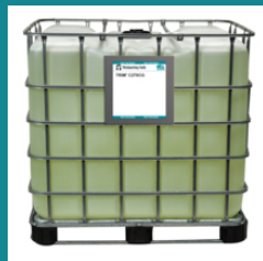
Cuve de 270 gallons (1022 l) SKU: C270CG-270G UPC-12: 641238042723

DeepL a peut-être été utilisé pour traduire certaines parties de cette fiche technique. N'hésitez pas à nous signaler toute erreur à corriger : webmaster4mfs@gmail.com