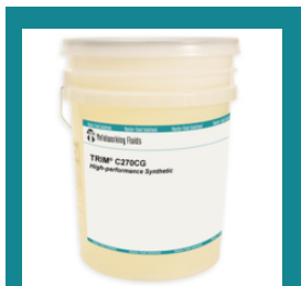
Seau de 5 gallons (19 l) SKU: C270CG-5G UPC-12: 641238042709