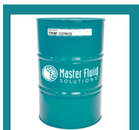
Fût de 54 gallons (204 l) SKU: C270CG-54G UPC-12: 641238042716