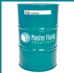
Fût de 54 gallons (204 l) SKU: C270CG-54G UPC-12: 641238042716