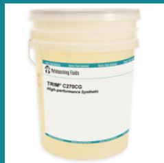
Seau de 5 gallons (19 l) SKU: C270CG-5G UPC-12: 641238042709