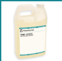
Bidon de 1 gallon (3,8 l) SKU: C270CG-1G UPC-12: 641238042686