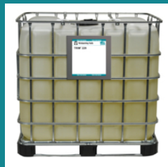
Cuve de 270 gallons (1022 l) SKU: 229-270G UPC-12: 641238033899

DeepL a peut-être été utilisé pour traduire certaines parties de cette fiche technique. N'hésitez pas à nous signaler toute erreur à corriger : webmaster4mfs@gmail.com