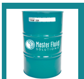
Fût de 54 gallons (204 l) SKU: 229-54G UPC-12: 641238000051