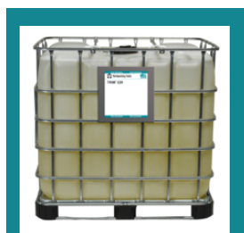
Cuve de 270 gallons (1022 l) SKU: 229-270G UPC-12: 641238033899

DeepL a peut-être été utilisé pour traduire certaines parties de cette fiche technique. N'hésitez pas à nous signaler toute erreur à corriger : webmaster4mfs@gmail.com