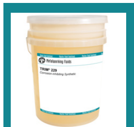
Seau de 5 gallons (19 l) SKU: 229-5G UPC-12: 641238000044