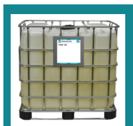
Cuve de 270 gallons (1022 l) SKU: 229-270G UPC-12: 641238033899

DeepL a peut-être été utilisé pour traduire certaines parties de cette fiche technique. N'hésitez pas à nous signaler toute erreur à corriger : webmaster4mfs@gmail.com