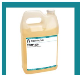
Bidon de 1 gallon (3,8 l) SKU: 229-1G UPC-12: 641238000013