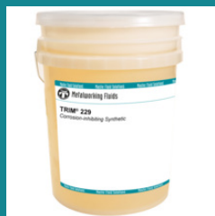
Seau de 5 gallons (19 l) SKU: 229-5G UPC-12: 641238000044