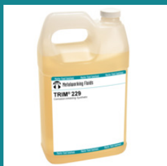
Bidon de 1 gallon (3,8 l) SKU: 229-1G UPC-12: 641238000013