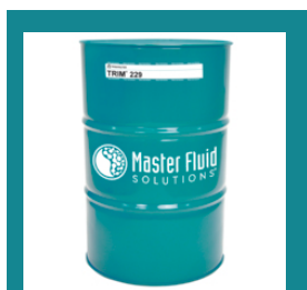
Fût de 54 gallons (204 l) SKU: 229-54G UPC-12: 641238000051