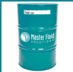
Fût de 54 gallons (204 l) SKU: 229-54G UPC-12: 641238000051