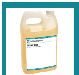
Bidon de 1 gallon (3,8 l) SKU: 229-1G UPC-12: 641238000013