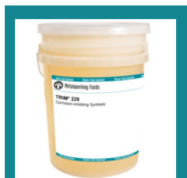
Seau de 5 gallons (19 l) SKU: 229-5G UPC-12: 641238000044